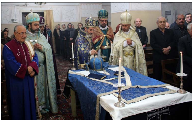
Ս. Պատարագի ասարտին հոգեհանգստեան արա-

Պատարագիչ Հայր Սուրբը, օրայ առթիւ իր քարոզի ընթացքում, բնաբան ունենալով կորնթացիներին գրած Պօղոս առաքելի առաջին նամակի՝ «Պարծենալու բան չունեմ, երբ Աւետարանն եմ քարոզում, որովհետեւ պարտաւոր եմ այդ անել, եւ վա՛յ ինձ, եթէ չքարոզեմ» (9.16) հատուաճը անդրադարձաւ Ղեւոնդեանց քահանաների վարքին ու հաւատի պաշտպանութեան ճանապարհին նրանց զոհագործմանը եւ շէշտեց, որ նրանք այդ ամէնը արժանաւորութեամբ ի կատար ածեցին՝ աղօթքին նւիրելով եւ դրանից հոգեւոր սնունդ ու զօրութիւն ստանալով: Գերայ. Հայր Սուրբը շնորհաւորելով քահանաներին իրենց տօնի առիթով, յորդորեց բոլոր ներկաներին՝ աշխարհական թէ հոգեւորական, միմեանց համար աղօթել եւ այդպիսով զօրանալ: