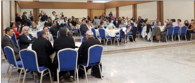
Վերջում գերպ. Հայր Սուրբը փոխանցեց իր օրհ-