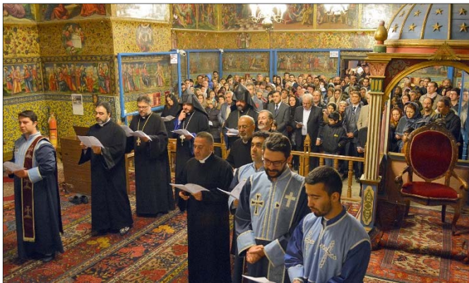
Արարողութեան ընթացքում Ս. Սեղանի վրայ վառ-

2017 թականի յունարի 1-ի առաջին պահերին՝ ժամը 00:50-ին, Ս. Ամենափրկչեան վանքի «Ս. Յովսէփ Արեմաթացի» եկեղեցում, հաւատարո հայորդիների ներկայութեամբ, կաթողիկոսական փոխանորդ գերայ. Տ. Սիփան Ծ. վրդ. Քէչէճեանի նախագահութեամբ եւ Շահինշահրի հայ համայնքի հոգեւոր տեսուչ գերայ. Տ. Անանիա Ծ. վրդ. Գունանեանի, հոգեւորականաց ու դպրաց դասերի մասնակցութեամբ, Գոհաբանական աղօթք մատուցեց Ամանորի առթիւ: