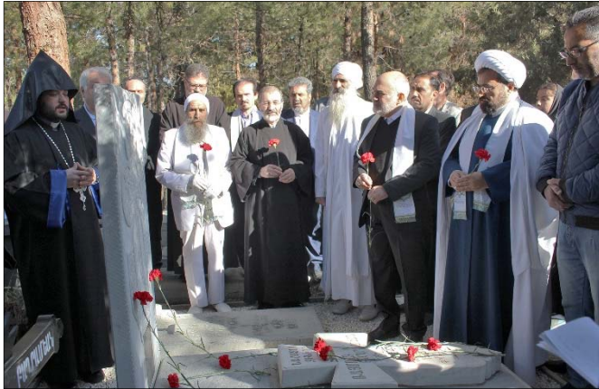
րական ծրագրեր իրականացան: