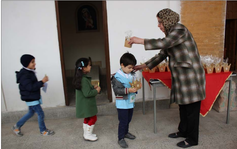
Եկեղեցեաց վարչության յանձնարարությամբ եւ մանկապարտէզ-նախակրթարանի Ծնողական խորհրդի միջոցով պատրաստած

մրգերը բաժանեցին սաներին, ապա Ս. Աստուածածին եկեղեցու Տիկնանց յանձնախմբի կազմակերպությամբ եկեղեցու սրահում տեղի ունեցաւ համեստ հիւրասիրութիւն, որտեղ մանկապարտէզի սաներից ոմանք իրենց գեղեցիկ ասմունքներով բազմապատկեցին ներկաների խանդավառութիւնը: