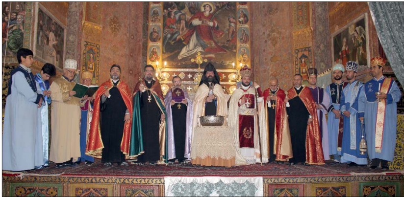
խանցեցին գերայ. Տ. Սիփան Ծ. վրդ. Քէչէճեանն ու արժն. Տ Վազգէն քինյ. Քէօշկէրեանը: