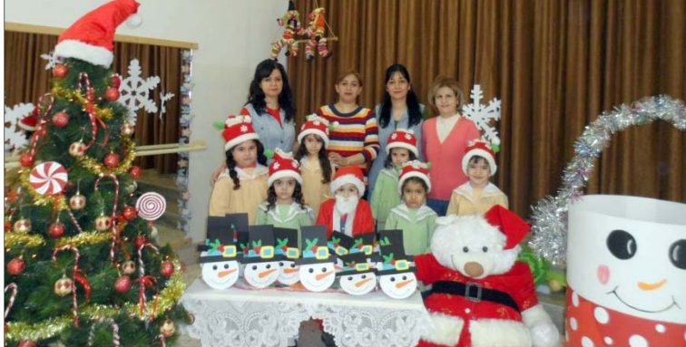
Խրախճանքի ընթացքում յայտնեցին բոլոր մանուկների սիրելի ձմեռ պապն ու ձիւնանուշը, ովքեր ջերմ ու հա- րազատ մթնոլորտում սաներին նկրեցին գեղեցիկ մրգեր: Օրուայ առիթով ներկաները վայելեցին նաեւ նախապատրաստուած համեղ տօնական տորթը:

Երեքշաբթի՝ թուականիս դեկտեմբերի 20-ի ա- ռաւօտեան ժամը 9-ից մինչեւ 11:30-ը, Ծահին- շահրի հայոց ազգային «Նարեկ» մանկապար- տէզ-նախակրթարանի յարկի տակ տօնական էր: Առիթը բոլորի կողմից միշտ սիրուած գեղե- ցիկ եւ մօտալուտ Նոր տարին էր: Դպրոցի տես- չութեան, ուսուցչական կազմի եւ ծնողական խորհրդի նախաձեռնութեամբ կազմակերպուած այս գեղեցիկ նախատօնակին՝ դպրոցի սաները գեղեցիկ տեսքով ներկայանալով՝ կատարեցին Ամանորին նկրուած խանդավառ երգեր ու պա- րային շարժումներ: