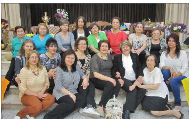
Կազմակերպությամբ Նոր Զուղայի Հայ Մ.Մ.

«Արարատ» միության Երեցների միաւորի, ուրբաթ՝ նոյեմբերի 11-ին, սկսեալ ժամը 11:00-ից միութեան հանդիսութիւնների դահլիճում հերթական անգամ տեղի ունեցաւ աշնանային վաճառք, որտեղ վաճառքի էր հանել աշնանային մրգերից ու բանջարեղէններից պատրաստած եւ գեղեցիկ փաթեթաւորած թխածքեղէն, թութեղէն, մրգանուշ, ճիւղի եւ այլ պահածոներ, որոնց բազմազանութիւնը վկայում էր միութեան Երեցների միաւորի վարչութեան ու ամբողջ անձնակազմի շաբաթների եւ ամիսների համատեղ ու արդիւնաւէտ ջանքերի մասին: