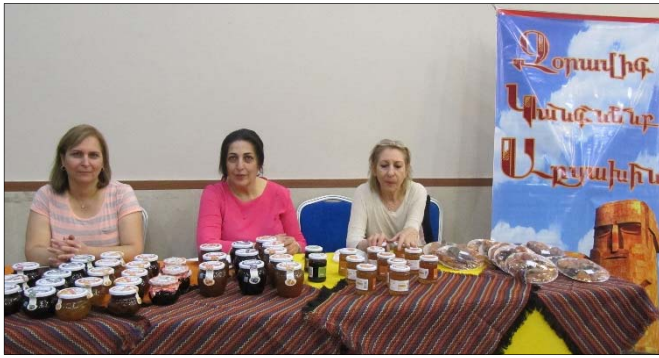
խից բերած մեղր, չիրեղէն, սուշուղ, մրգանուշների տե-

սականի եւ թթի դոշաք, ինչպէս նաեւ Փերիոյ կրթասիրաց եւ Հայ ուս. Չհարմահալ միութիւնները՝ միութեան անդամները միջոցով պատրաստած պահածոների ու թխածքների վաճառքով: