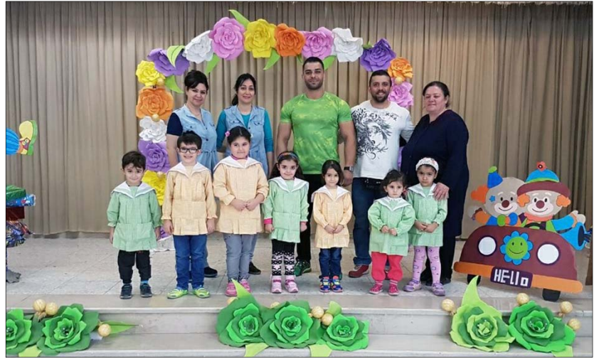
Գերայ. Հայր Սուրբը եւ Հայ Համայնքի Վարչութիւնը համակ ու- շաղրութեամբ ունկնդրեցին շնորհալի ախոյեանների արտայայտու-

առաջարկություն էին ստացել Հայաստանի Հանրապետությունում հաստատելու տարբերակը. ընդունելու դեպքում նրանց կը տրամադրվեր մարզական հնարատրություններ՝ իրենց մասնագիտութեամբ զբաղելու ուղղութեամբ: