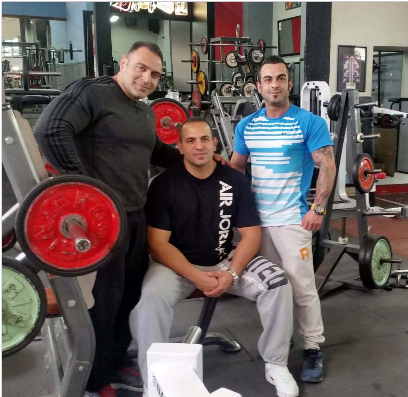
Յունարի 28 եւ 29-ին, մարմնամարզություն մարզաձեռի Սպահան

«Մասիս» մարմնամարզության ակումբի տնօրինությունից տեղեկացել ենք, որ սույն կենտրոնի երեք հայ մարզիկները մասնակցելով մարմնամարզության եւ բազկամարտի Սպահան նահանգի ու երկրի առաջնությունների մրցույթներին՝ արձանագրել են փայլուն յաջողություններ: