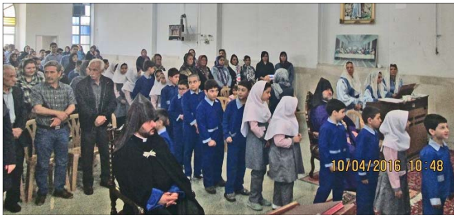
Օրուայ առիթով քարոզեց թեմակալ առաջնորդ Սրբ-

Գերշ. Սրբազան Հայրն ընդգծեց ի սփիւսս աշխարհի համայն հայութեան միասնականութիւնն ու մարտունակ ոգին՝ հայրենի սուրբ հողը պաշտպանելու նիրական գործում: