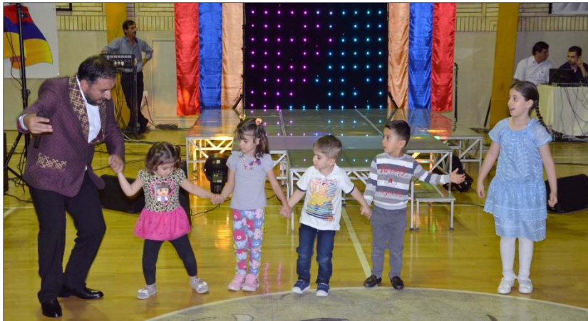
Երեկոյի պաշտօնական բաժնին յաջորդեց գեղարուեստական ծրագիրը, որտեղ ազգային, լեռափոխական եւ ժողովրդական երգերի կատարմամբ մտերմիկ ու խանդավառ մթնոլորտ ստեղծեց Հայաստանի Հանրապետութեան վաստակաւոր արտիստ Արսէն Գրիգորեանը:

Վերջում Սրբազան Հայրը շնորհաւորելով առիթի կապակցութեամբ՝ մաղթեց, որ Հայաստանի պետականութիւնն ու բանակը օրըստօրէ առաւել զօրանան եւ հայ ժողովուրդը գոյատեւի ու ստեղծագործի: