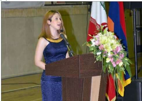
Սպահանի հայոց թեմի Թեմական

խորհրդի նախաձեռնութեամբ կազմակերպւած այս միջոցաւմանը ներկայ էին նաեւ թեմակալ առաջնորդ գերշ. Տ. Բարգէն արք. Չարեանը, Իրանում Հայաստանի արտակարգ եւ լիազօր դեսպան Արտաշէս Թումանեանը, դեսպանատան պաշտօնատարներ, Շահինշահրի հայ համայնքի հոգեւոր տեսուչ հոգշ. Տ. Անանիա վրդ. Գունանեանը, քահանայից դասը եւ ազգային մարմինների ու շրջանի Հայ Դատի յանձնախմբի անդամներ: