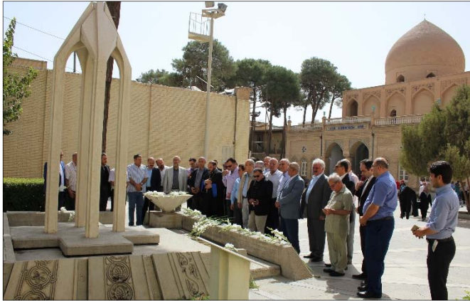
դամներին՝ Հայ դատի խնդրով նրանց զօրակցության