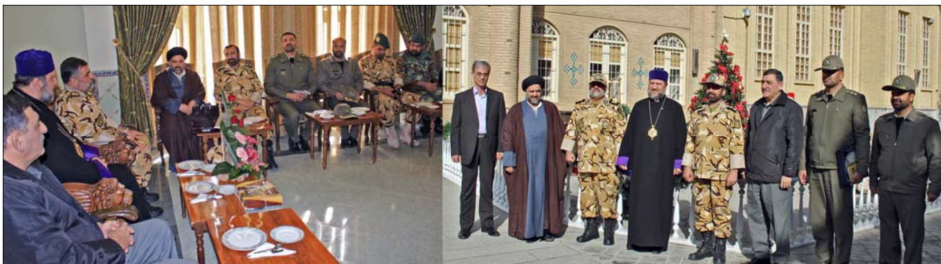
զ) Սպահանի պետական համալսարանի տնօրէն եւ միջազգային յարաբերութիւնների բաժնի պետ