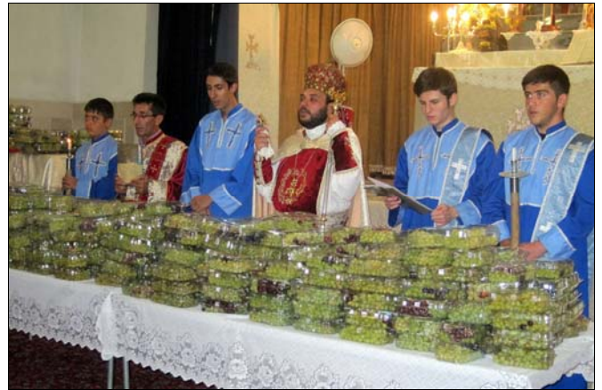
Յաւարտ Ս. Պատարագի տեղի ունեցաւ Խաղողօրհնէքի արարողութիւն եւ Ծափնշահրի հայ կանանց եկեղեցասիրաց միութեան անդամուհիների համագործակցութեամբ ու դասատրութեամբ օրհնած խաղողը բաժանեց ներկաներին:

կութիւն եւ գործի յաջողութիւն, իսկ մայրերին արեւատուութիւն պարգեւի, ապա իր եւ Ծափնշահրի հայ համայնքի վարչութեան անունից շնորհաւորեց բոլոր նրանց՝ որոնց անան տօնն էր, յատկապէս Մարիամ անուն ունեցողներին եւ շնորհակալութիւն յայտնեց Ծափնշահրի հայ կանանց եկեղեցասիրաց միութեան անդամներին, դպրաց դասին, երիտասարդներին եւ բոլորին՝ իրենց գեղեցիկ ներկայութեան համար: