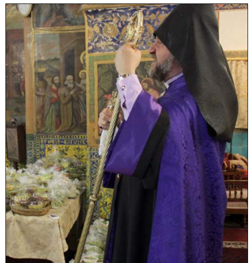
Յընթացս Ս. Պատարագի Առաջնորդ Սրբազան Հայրն իր հայրական